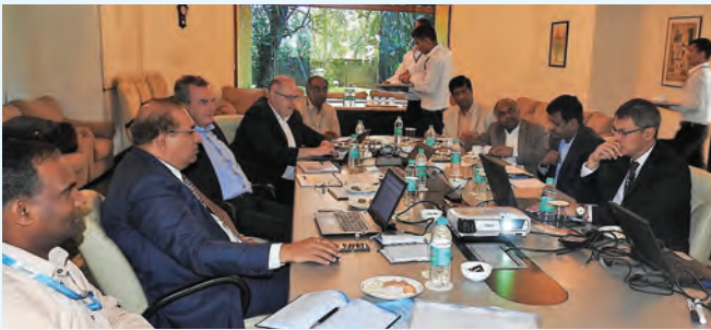
बीटीएसएल व्यापार कार्यशाला बैठक