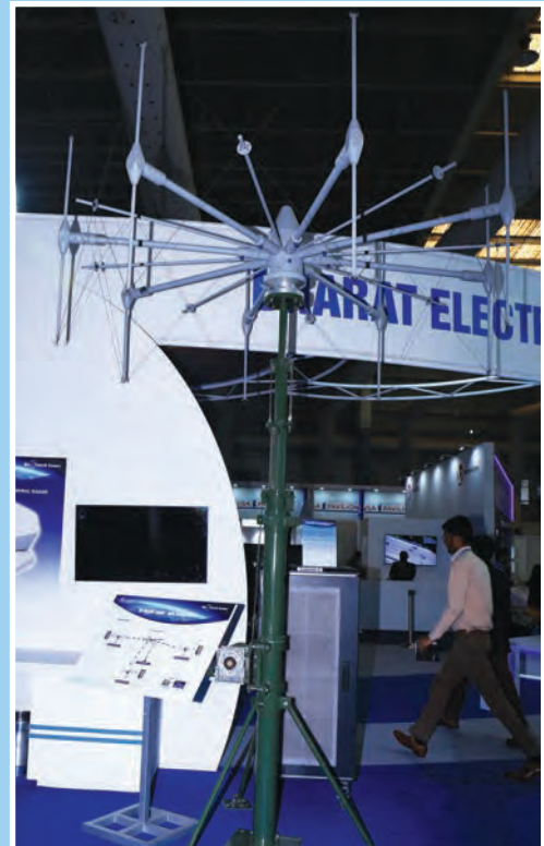
बीटीएसएल स्टाल पर निष्क्रिय रडार का प्रदर्शन