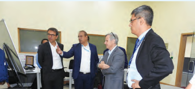
सी ई ओ बीटीएसएल थालेस कार्यपालक के साथ बातचीत करते हुए