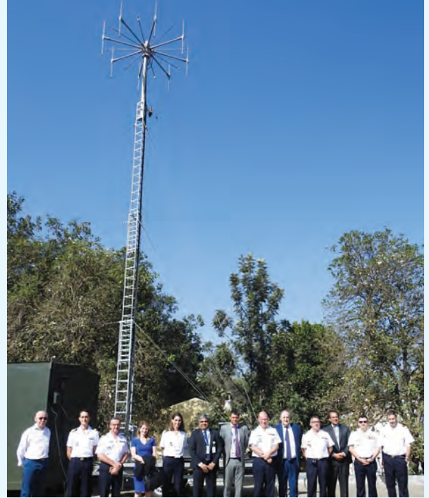
डीजीए के प्रतिनिधि, फ्रेंच सरकार के रक्षा खरीद एजेंसी भारत में फ्रेंच दूतावास प्रतिनिधि बीटीएसएल तथा थालेस कार्यपालक के साथ में