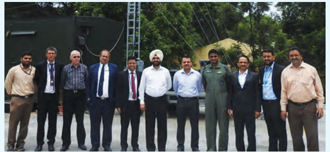
भारतीय वायु सेना के प्रतिनिधियों के साथ बीटीएसएल में बीटीएसएल और बीईएल के अधिकारियों की एक तस्वीर