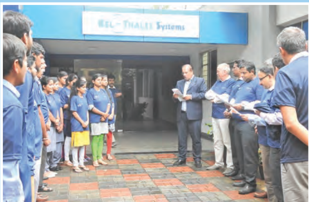
स्वच्छता प्रतिज्ञा लेती बीटीएसएल टीम