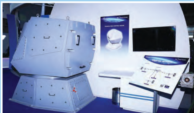
बीटीएसएल स्टाल पर फेरस रडार का प्रदर्शन