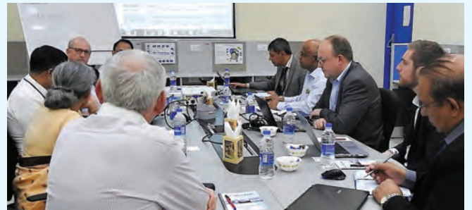
बीटीएसएल में निष्क्रिय रडार मूल्य प्रस्ताव कार्यशाला. प्रतिभागी थालेस, बीईएल तथा बीटीएसएल से.