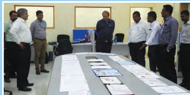
बीटीएसएल में सतर्कता जागरूकता पोस्टर प्रतियोगिता