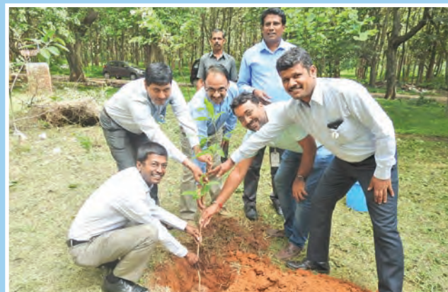
स्वच्छता पखवाड़ा के दौरान बीटीएसएल की टीम वृक्षारोपण करते हुए