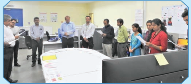
सतर्कता जागरूकता की शपथ लेती बीटीएसएल टीम