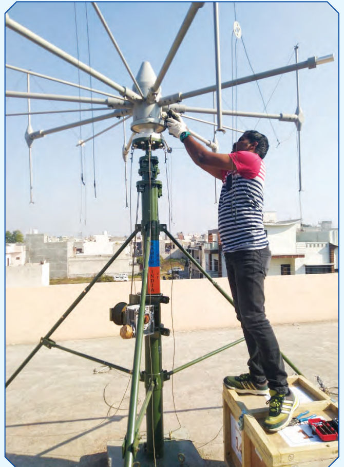
ग्राहक को निष्क्रिय रडार की क्षमता का प्रदर्शन।