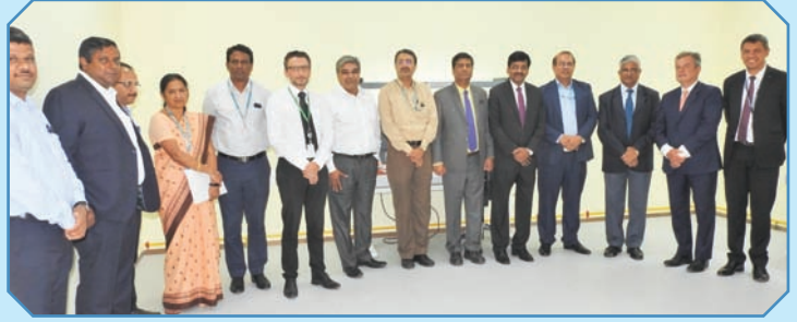
बीटीएसएल में रक्षा सुविधा प्रणाली के उद्घाटन के दौरान बीईएल, बीटीएसएल और टीआरडीएसएल के अधिकारियों के साथ बीटीएसएल के निदेशक मंडल।