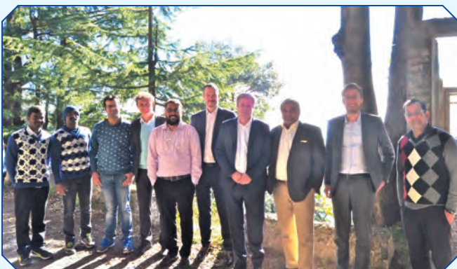
निष्क्रिय रडार प्रदर्शन स्थल पर बीटीएसएल और थेल्स के कार्यकारी।