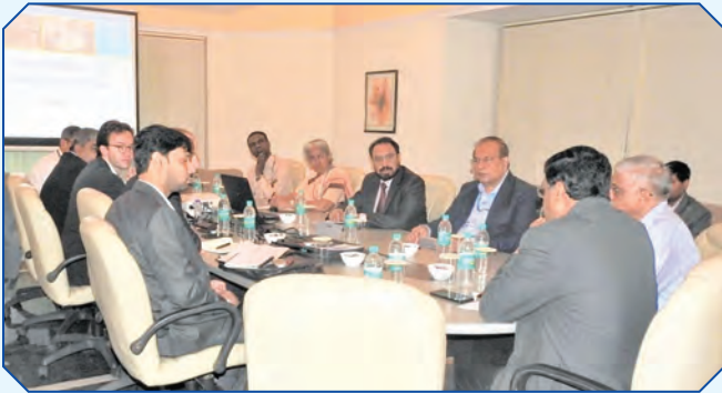
बीटीएसएल कार्यशाला बैठक के दौरान बीटीएसएल, बीईएल और थेल्स के कार्यकारी।