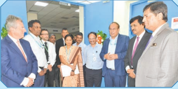
बीटीएसएल में रक्षा सुविधा केंद्र के उद्घाटन के दौरान बीटीएसएल, बीईएल के अधिकारियों के साथ बीटीएसएल के निदेशक मंडल।